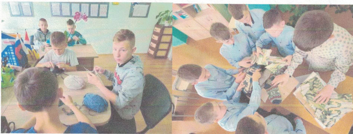
Фото: Участники акции “Своих не бросаем”

Воспитанники во время работы над созданием новой вещи высказали надежду, что переданные предметы одежды, которые они изготовили своими руками, согреют не только от холода, но и напомнят о том, что военнослужащих ждут дома и переживают за них. Подарки и письма, написанные учениками школы российским военным, были переданы “Боевому братству”.