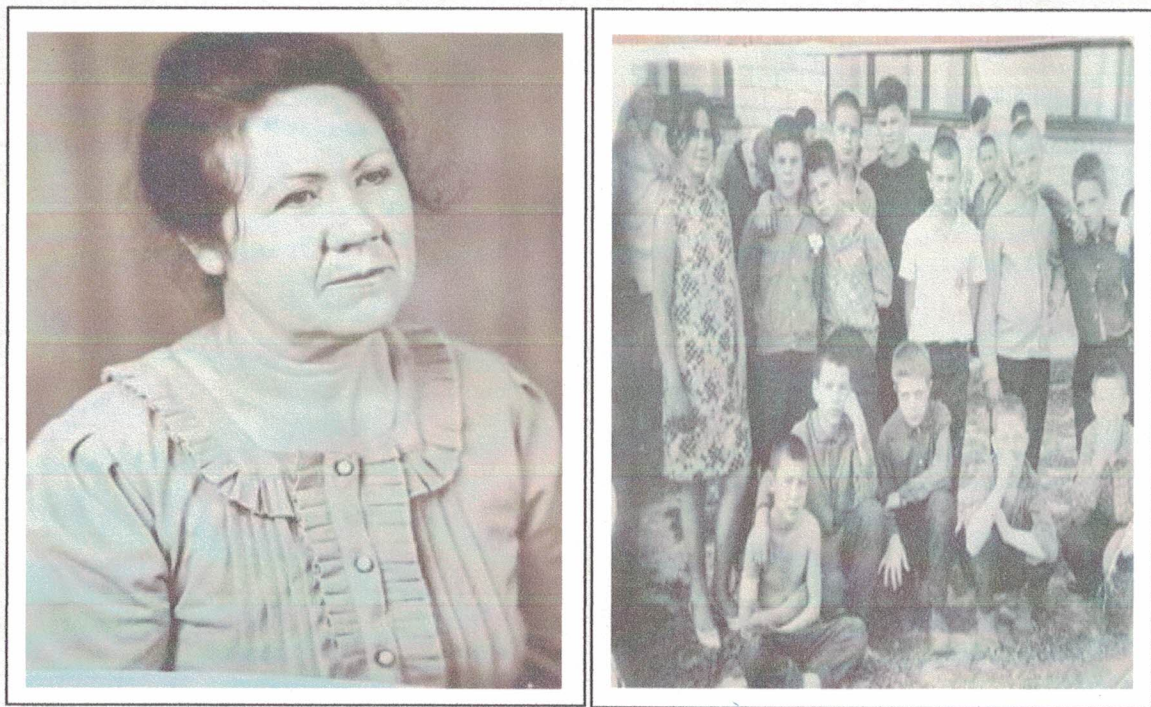
Фото: Безвершенко Людмила Григорьевна

Нет такого дела, за которое бы не взялась Людмила Григорьевна, и с которым бы не справилась. Её фотография находится в музее Н. К. Крупской.