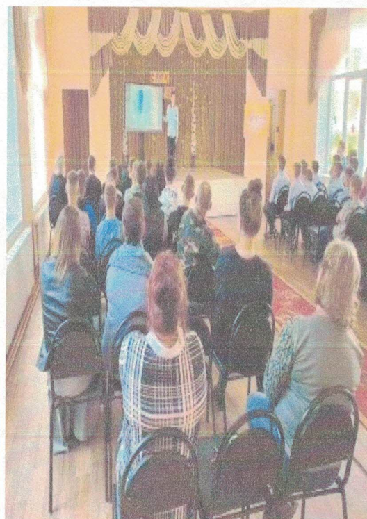
Фото: Праздничный концерт

Л.В. Панчеко, газета "На школьной волне"